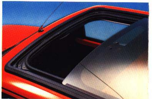
Toit ouvrant en option.